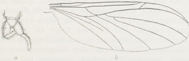
Fig. 1. Platyura forcipata n. sp. ♂. a = Zange; b = Flügel.

Stirn, Scheitel und Hinterkopf mattschwarz; die Behaarung am Hinterkopfe kurz, schwarz. Die Punktaugen stehen auf einem flachen Dreiecke, das mittelste ist das kleinste und liegt in einer seichten Rinne, die sich von den Fühlerwurzeln bis zum Scheitel zieht. Untergesicht bräunlich, grau bestäubt; der Mundrand lappenförmig vortretend. Fühler etwas länger als Kopf und Thorax zusammen; die zwei Basalglieder gleichlang, hell bräunlichgelb; die Geißel fein pubescent braun, nur die Basis des ersten Gliedes hell; die einzelnen Glieder länglich vier-