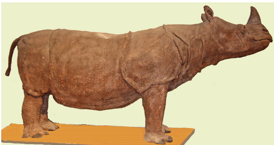
5. ábra. Az MTM montírozott Rhinoceros sondaicus sondaicus példánya (HNHM 1100.107) műanyag tülökkel

A HNHM 1100.107 példány méretei (a montírozott állaton utólag felvéve) a következők: marmagasság 130 cm, teljes testhossz 300 cm, farokhossz 50 cm.