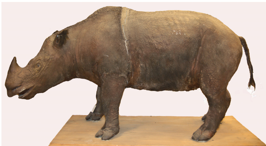
1. ábra. Az MTM montírozott Dicerorhinus sumatrensis sumatrensis példánya (HNHM 68.583.1.)