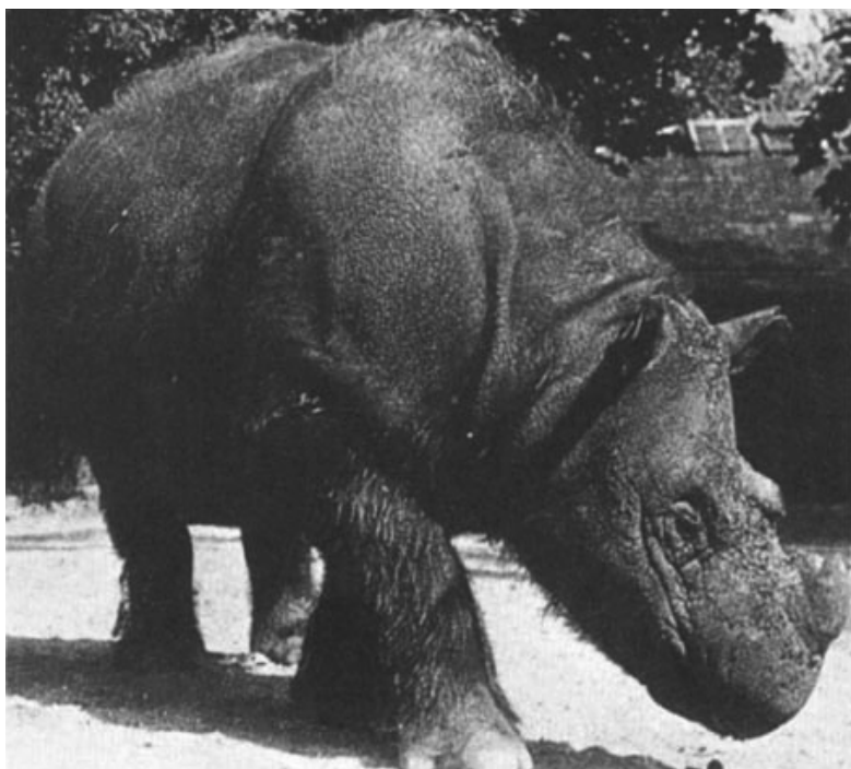
4. ábra. „Subur” szumátrai orrszarvú a koppenhágai állatkertben (GROVES & KURT 1972) Fig. 4. “Subur”, the Sumatran rhino of the Copenhagen Zoo (GROVES & KURT 1972)