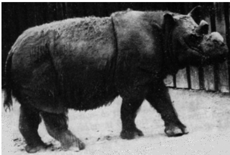
3. ábra. Szumátrai orrszarvú (ANGHI 1964), melyet a HNHM 68.583.1. számú példánynak gondoltak Fig. 3. Captive Sumatran rhino (ANGHI 1964) thought to be the HNHM 68.583.1. specimen